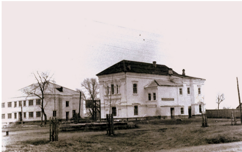
Арх.Э.Э.Вильфарт.Здание сиротского приюта. Фото сер. XX века