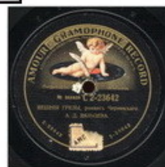
Пластинка с романсами Вяльцевой