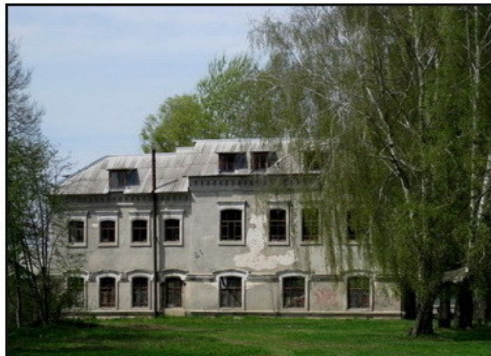
Красноармейская площадь, 21 (15).