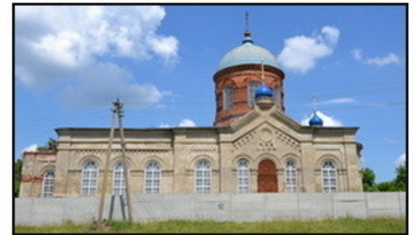
Церковь Николая Чудотворца в Бакланово Орловская обл., Орловский р-н, с. Бакланово (1898-1909 гг.)