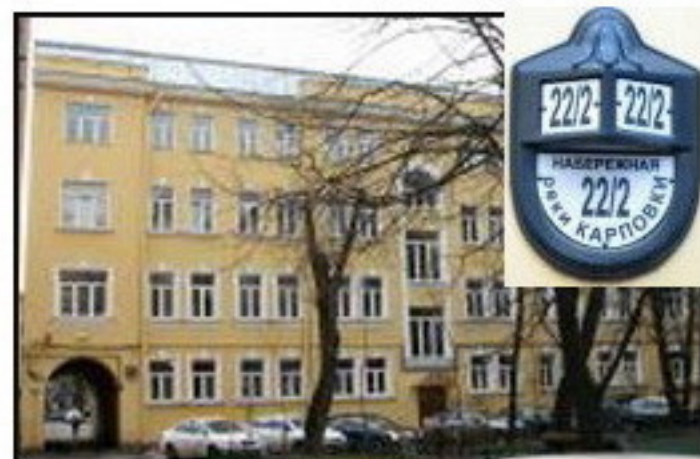
Сохранившийся флигель дома, Карповка, 22/2