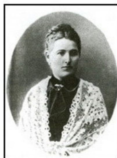
Мария Тихоновна Вяльцева