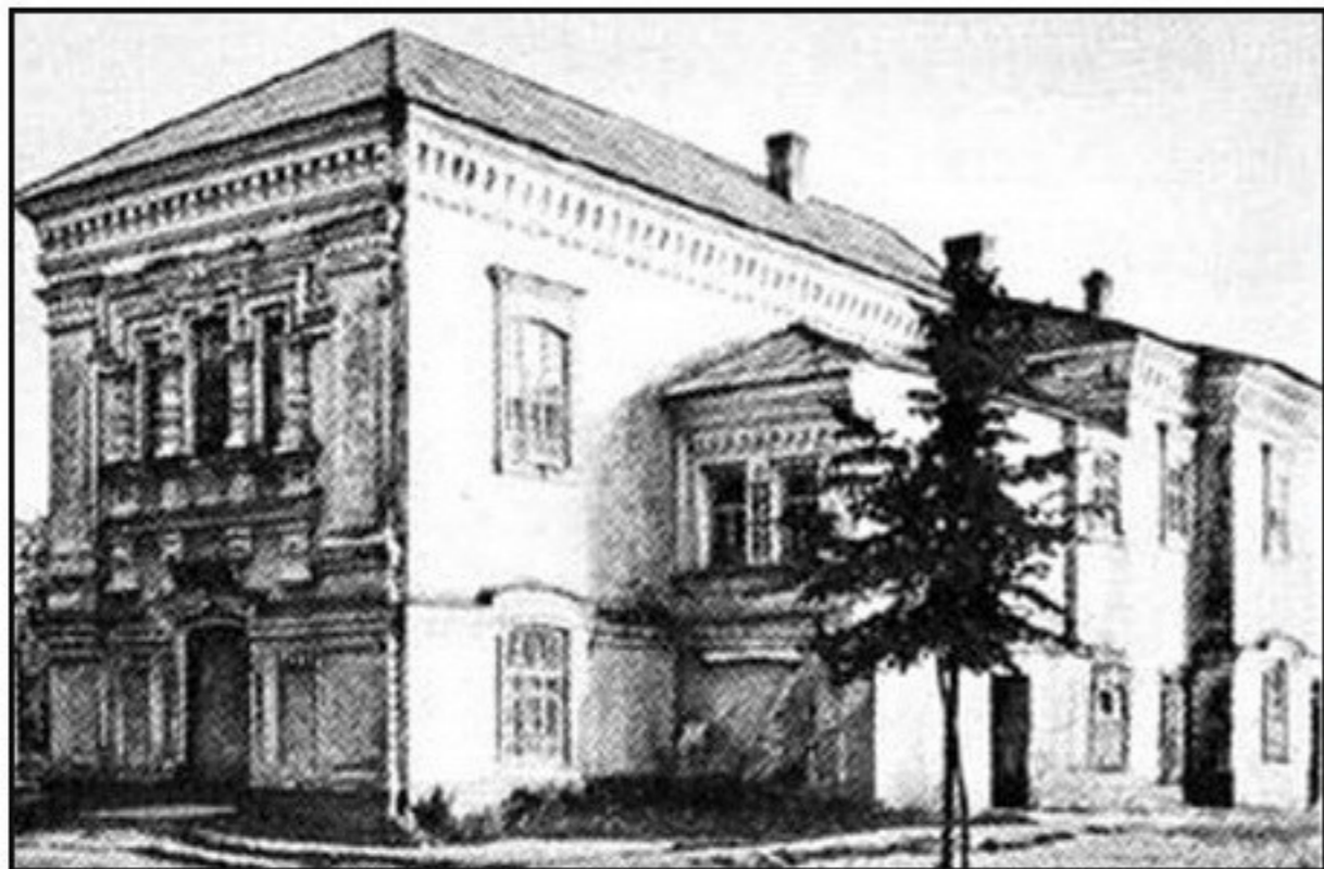
Памятник архитектуры регионального значения