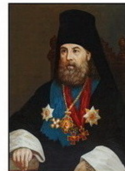
Епископ Орловский и Севский Симеон