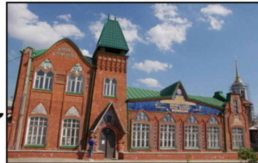
Современный вид здания