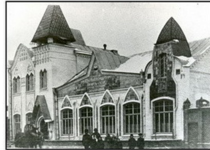
г.Елец.Здание яслей для работниц табачной фабрики(ныне Елецкий краеведческий музей) построено в стиле модерн в нач. XX в.