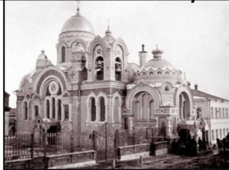
Великокняжеский храм - Елецкая "жемчужина", построен в русско-византийском стиле