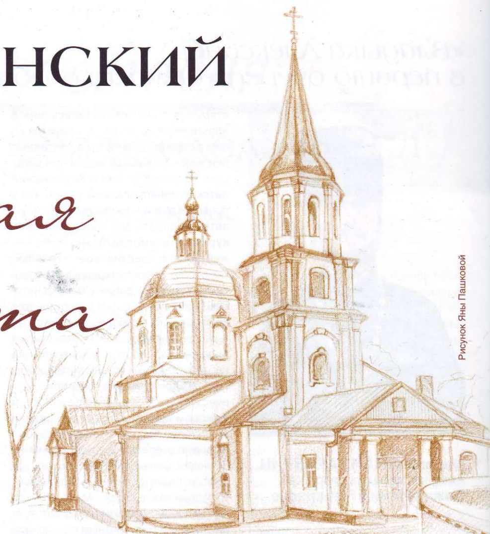
Рисунок Яны Пашковой

Если смотреть на брянский Тихвинский храм со стороны дороги, он, как и положено церковному зданию, располагается на возвышенности.