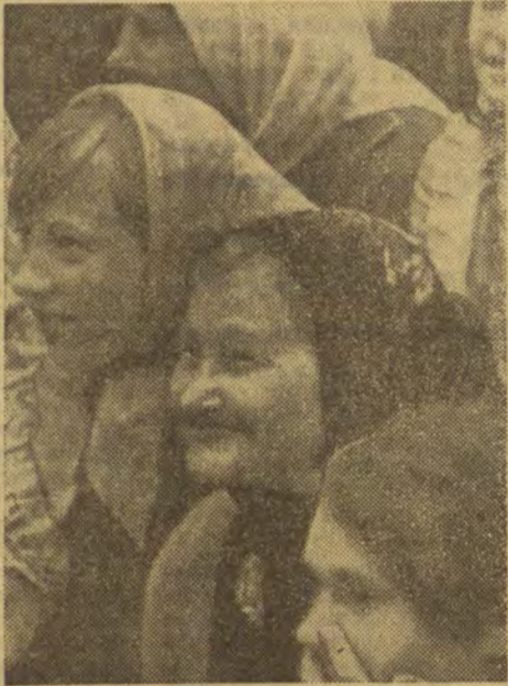
праздников — искусства, которые у нас становятся обычаями.

Партийный ум и народная мудрость дали нам возможность на все быстрее растущей материальной базе развивать все более богатую культуру, все более полноценный союз ума и чувств. И я не случайно сказал, что такие явления, как литературные праздники, хотя и не только они одни, выводят нас без всякого преувеличения на вершины современной духовной жизни. Америка, например, — технически развитая страна и в обобщении богатая, но в Америке не известно, что такое встречи писателя с рабочими и земледельцами, в Америке нет и не может быть таких Дней литературы, таких