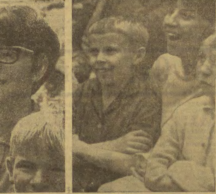
Слушают поэтов...

Вчера литераторы выехали в районы области, на предприятия. Дни советской литературы на Брянщине продолжаются.