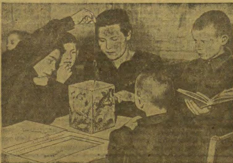
Очень интересная игра

...Счастливая, веселая жизнь у учащихся школы-интерната.