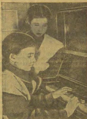
Впервые за пианино

вины девятого и до полдня — учеба в классах, далее — второй завтрак, прогулка на воздухе. После прогулки дети садятся за приготовление уроков. На это им отводится один час. После