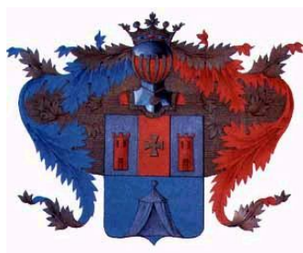
Герб рода Брусиловых