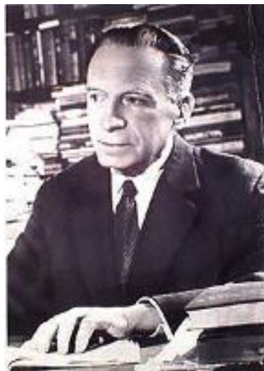
Чижевский А. Л.

В 1917 г. окончил Московский археологический институт, а в 1918 г. - Московский коммерческий институт. Учился также на физико-математическом и медицинском факультетах Московского университета. Преподавал (1917-1927 гг.) в Московском университете и Московском археологическом институте курс физических методов археологии.