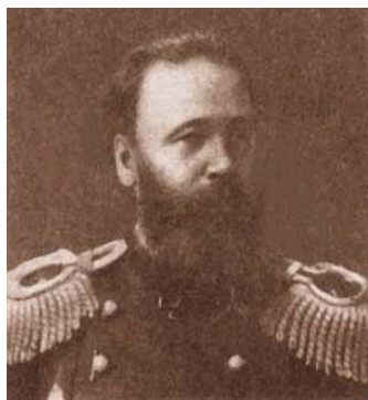
Доброславин Алексей Петрович

Алексей Доброславин родился 29 сентября (11 октября н.с.)