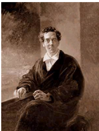
Перовский А. А.

А.А. Перовский родился 20 июля 1787 г. Он получил образование в Московском университете, а через два года ему было присвоено звание доктора философии и словесных наук. Он сближается с пушкинским окружением, знакомится с Карамзиным и Жуковским.