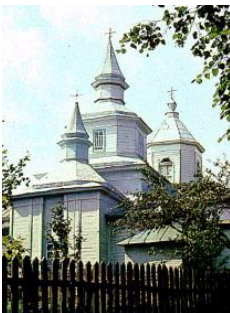
Церковь в Красном Роге: усыпальница А.К. Толстого

В ней бывали Я.П. Полонский, А.А. Фет, И.С. Тургенев и др. В 1860-г гг. Толстой создал здесь исторический роман "Князь Серебряный", драматическую трилогию "Смерть Иоанна Грозного", "Царь Федор Иоаннович", "Царь Борис", опубликовал сборник стихов.