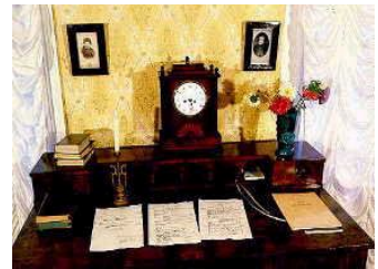
Рабочий стол А.К. Толстого

Выйдя в отставку в 1861 г., Толстой вместе с женой Софьей Андреевной (урожд. Бахметева) жил под Петербургом в имении Пустынька, затем в Красном Роге. Усадьба с богатой библиотекой и художественной галереей стала любимой обителью писателя.