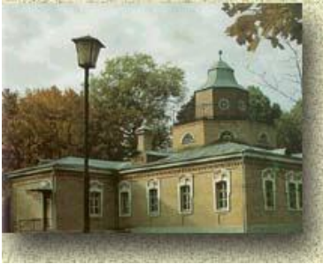
Литературно-мемориальный музей А.К. Толстого

А.К. Толстой (1817-1875) считал усадьбу своей истинной родиной. О проведенных в усадьбе детских годах Толстой писал: "Я очень рано привык к мечтательности, вскоре превратившейся в ярко выраженную склонность к поэзии. Много содействовала этому природа, среди которой я жил: воздух и вид наших больших лесов, страстно любимых мною, произвели на