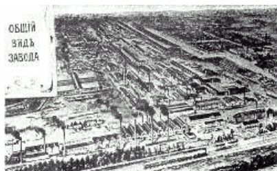
БМЗ в 1911 г.

Сборник сведений о благотворительности в России с краткими очерками благотворительных учреждений в С-