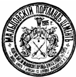
Первая торговая марка предприятия

Акционерное общество Мальцовских заводов. Отчеты... за 1895-1916 гг. - Спб., 1896-1917.