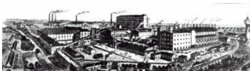
Так выглядел "Мальцовский портландцемент" в 1912 году.

О.В. Горбачев, А.М. Дубровский, Ю.Б. Колосов, В.В.