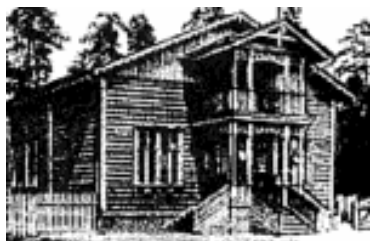
Народная столовая, построенная княгиней Тенишевой в Бежице (снимок 1914 г.)

История Брянского края. Ч.1: С древнейших времен до конца XIX века/О.В. Горбачев, А..М. Дубровский, Ю.Б. Колосов, В.В. Крашенинников, Е.А. Шинаков. Изд. 2-е с доп. и уточн. - Брянск, 2001.- С. 180-181, 235-238.