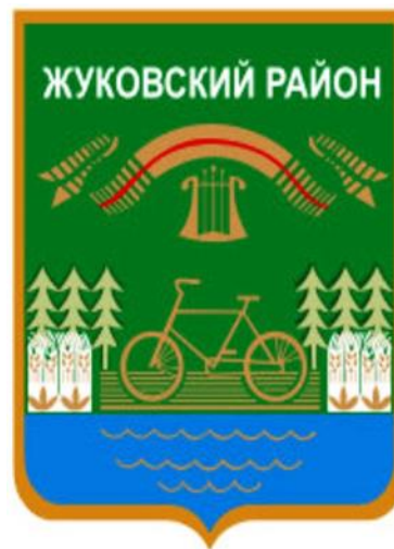
Герб г. Жуковка Брянской области Герб Жуковского района Брянской области