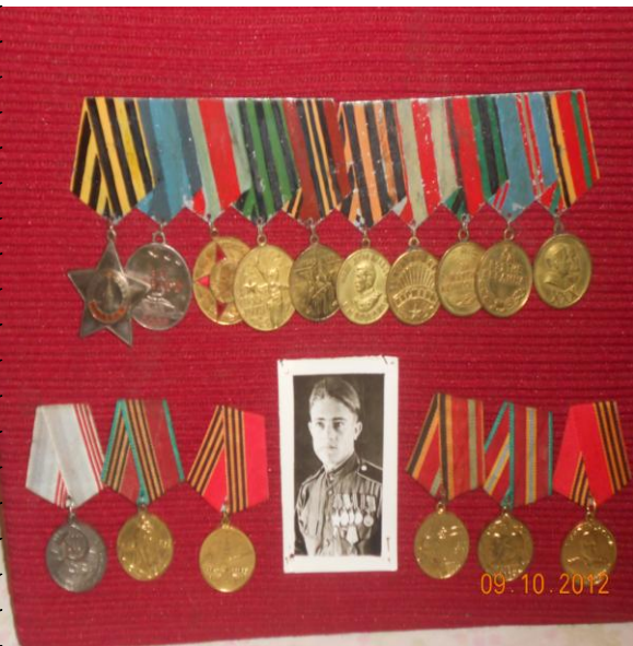
Боевые награды прадедушки.

Победу прадедушка встречал в Берлине, а после продолжал военную службу в Бресте. Демобилизовался в 1950 году. Вернулся домой, женился, вырастил двоих детей, почти 40 лет трудился на Сещинской железнодорожной станции. До конца своих дней достойно нес звание солдата Победы и просто был настоящим человеком. Жизнь прожита не зря. И молодость прошла не впустую. Главное – победили. Отечество отстояли.