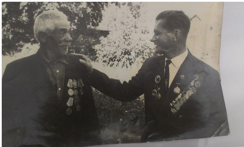
Рис 11. Прадедушка со своим боевым товарищем.

приезжали корреспонденты газеты «Вперед» и он со слезами на глазах доставал медали и рассказывал о боях, о Войне.