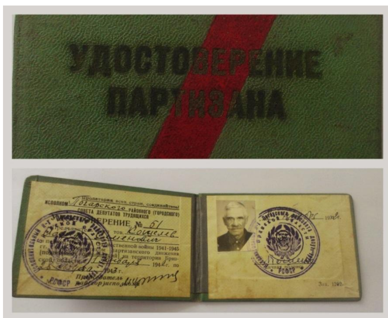
Рис 3. Удостоверение партизана