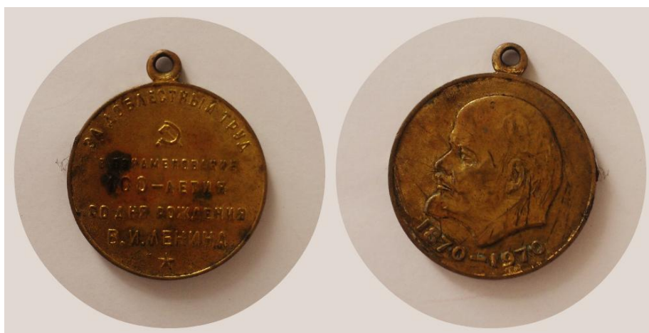
Рис 9. Медаль «за доблестный труд»

С войны прадедущка пришел раненый, было тяжелое ранение в ногу. После этого он все время ходил с палочкой, давали о себе знать осколки которые остались в ноге.