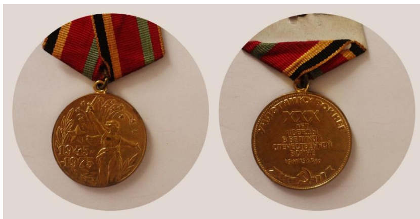
Рис 6. Юбилейная медаль «30 лет победы»