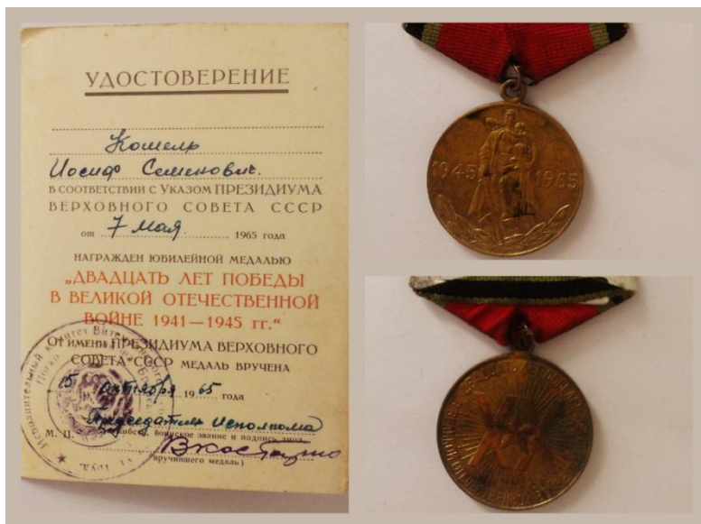
Рис 5. Удостоверение и юбилейная медаль «20 лет победы».