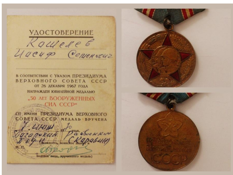
Рис 7. Юбилейная медаль «50 лет Вооруженных сил СССР»