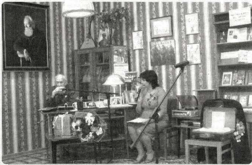
Кабинет В.Д. Динабургского в историко-краеведческом музее Брянского района

За счет средств районного бюджета одаренным детям и талантливой молодежи Брянского района выплачиваются 55 именных стипендий размером 1500 руб.,