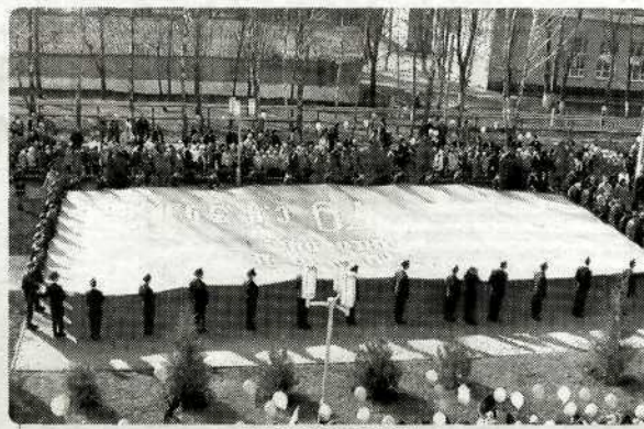
«Под Знаменем Победы...»

— В рамках региональной «Вахты Памяти» совместно с поисковым от-