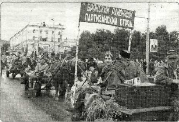
Брянский район в «партизанском обозе»

— На сегодняшний день наиболее востребованная и перспективная область музейной деятельности — работа с детьми и подростками. Широкое распространение получили обзорные и тематические экскурсии, интерактивные занятия, музыкально-театрализованные представления, историко-краеведческие, военно-патриотические, этнографические, экологические мероприятия для детской и взрослой аудитории. Более двух тысяч человек посетили музей только в рамках праздничных мероприятий к 70-летию Победы: воспитанники детских садов и школ Брянского района,