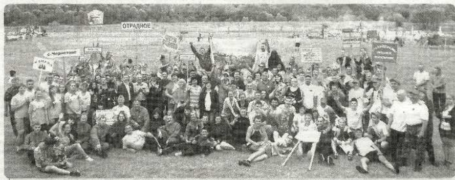
«МОСТ — молодежный, спортивный, твой», с. Хотылево

студенты Брянского техникума машиностроения и радиоэлектроники, БГТУ, сотрудники МФЦ Брянского района, коллективы и воспитанники учреждений спорта Брянского района, коллектив Новодарковичского дома-интерната, сотрудники департамента здравоохранения Брянской области, департамента семьи Брянской области, сотрудники соцзащиты, представители Пенсионного фонда с бывшими руководителями Брянского района.