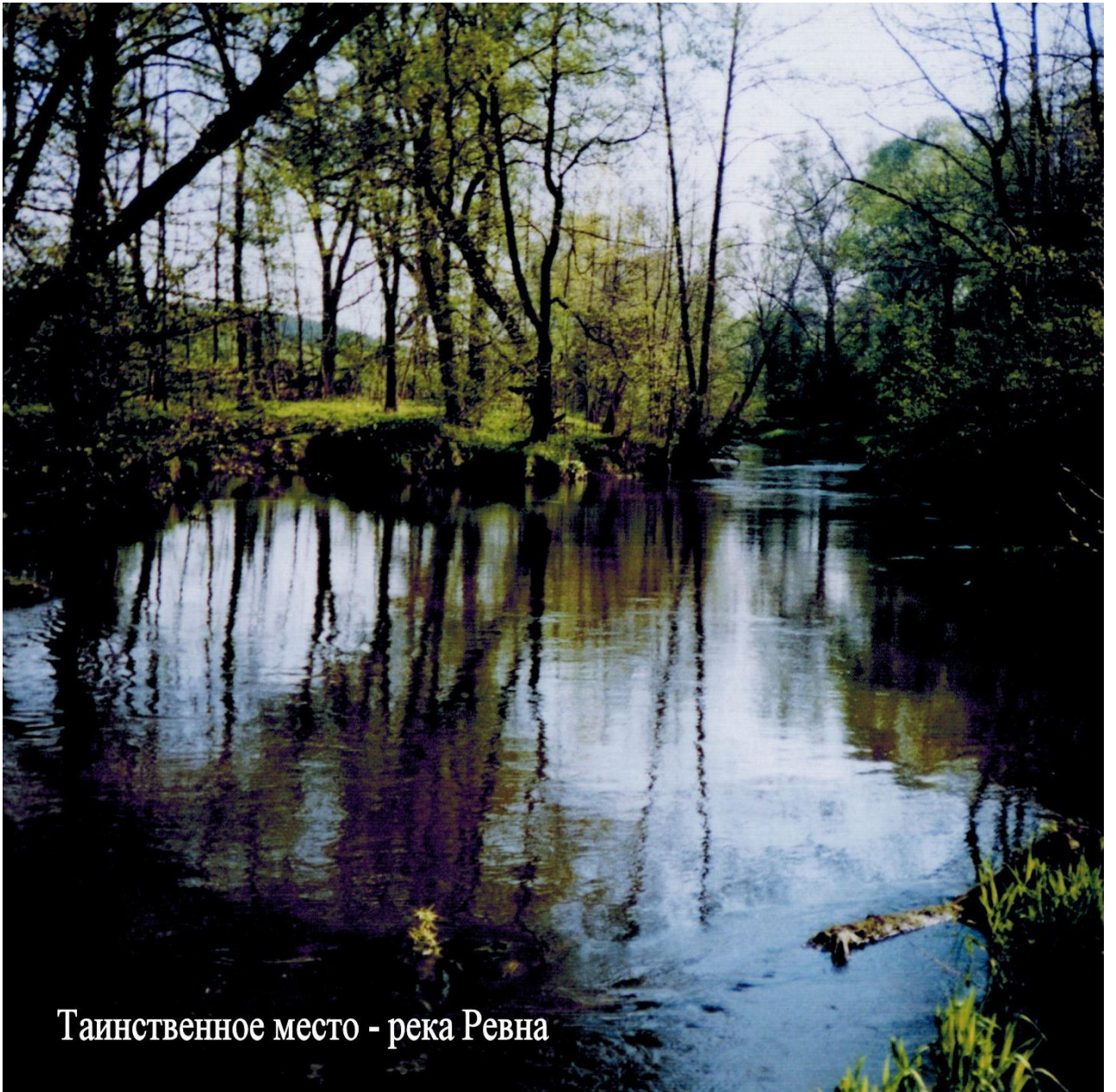
Таинственное место - река Ревна