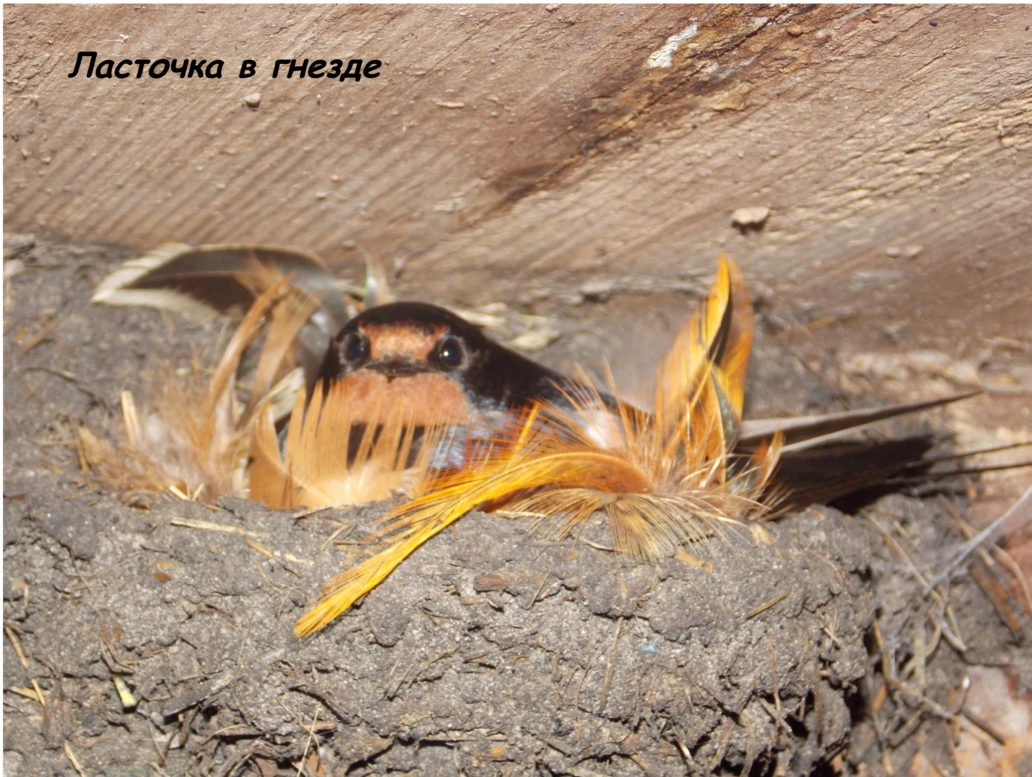
Ласточка в гнезде