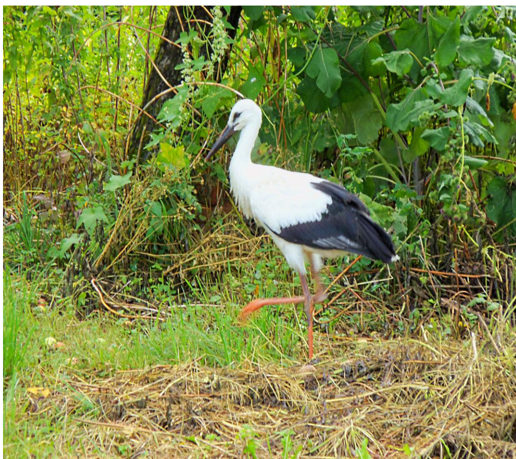
Уже вышел в свет