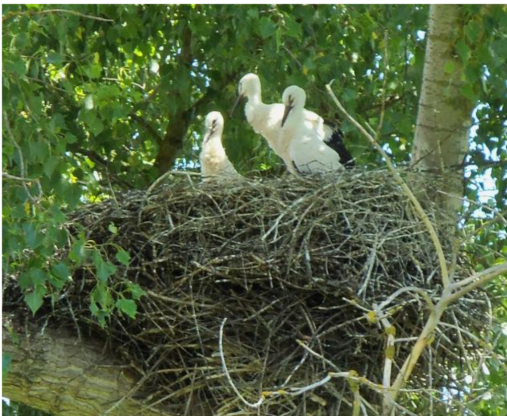
В гнезде аистином всё чинно и тихо