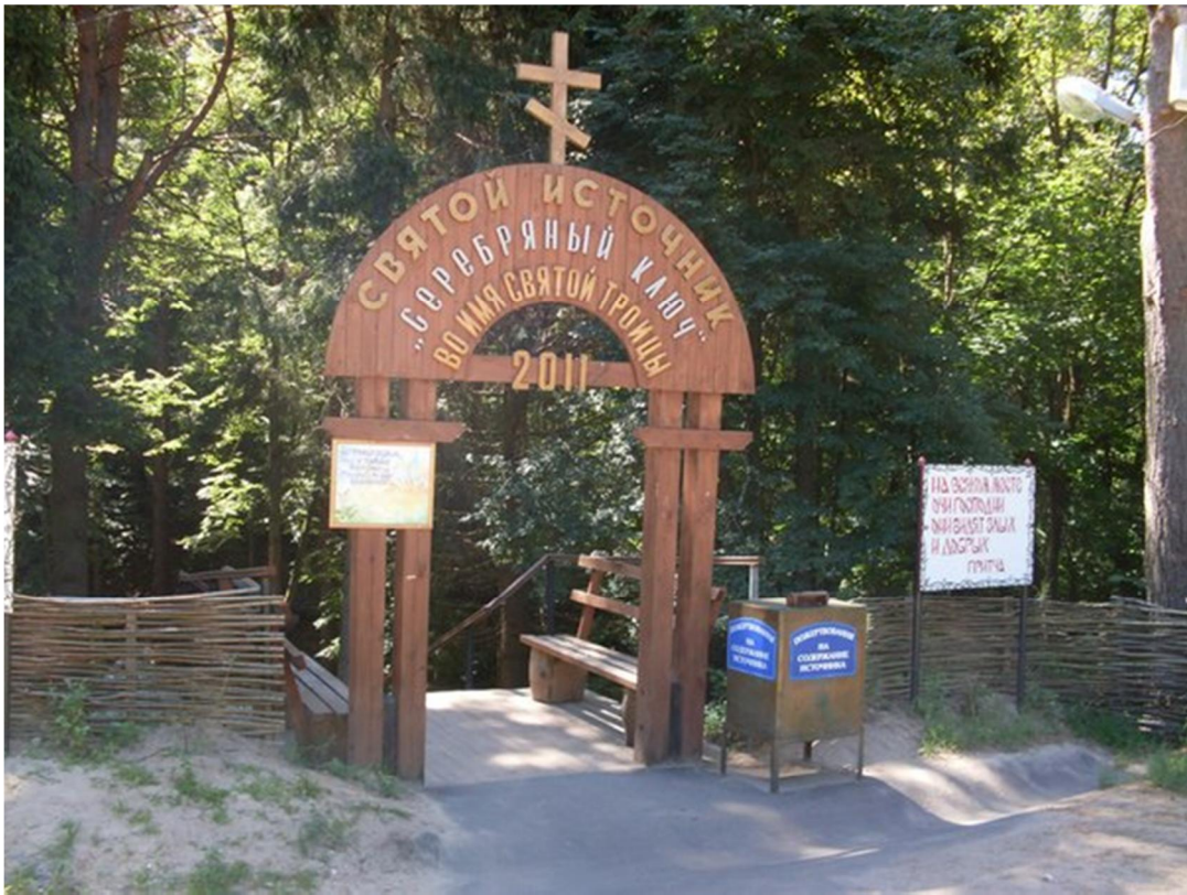
На пороге к источнику