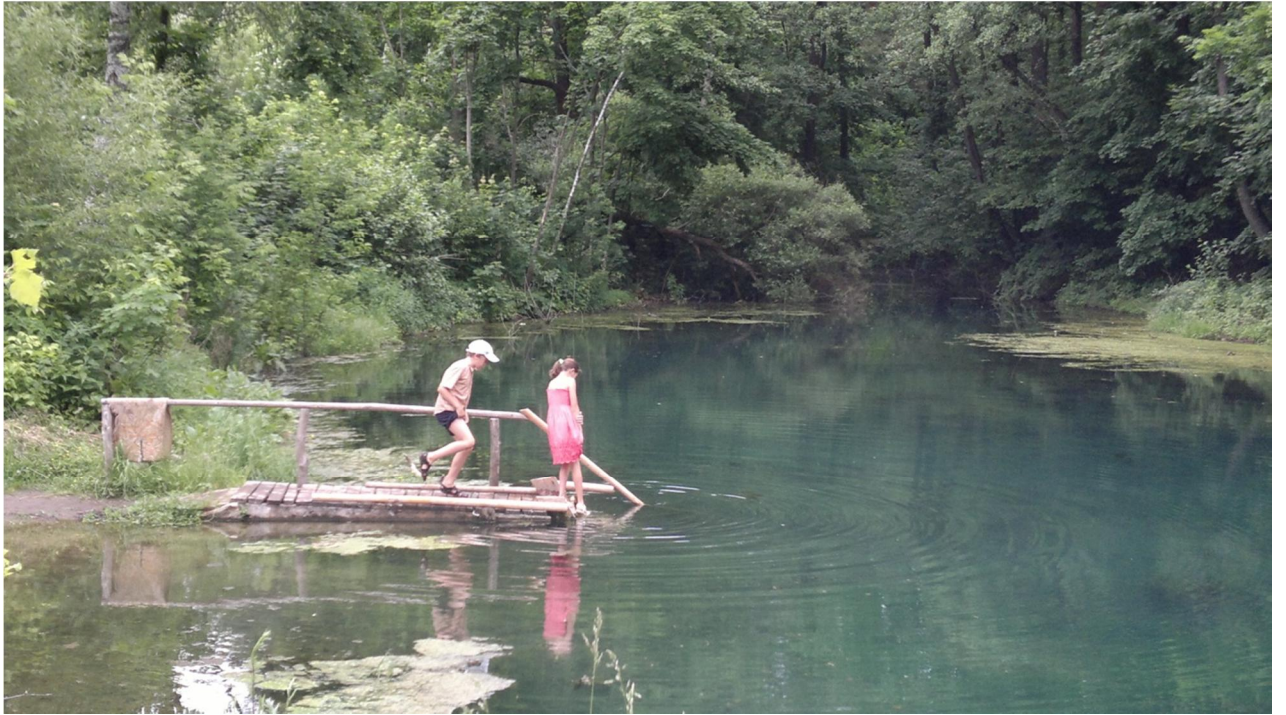
Вода из источников, насыщенная ионами серебра, стекает в озеро необыкновенно голубого цвета