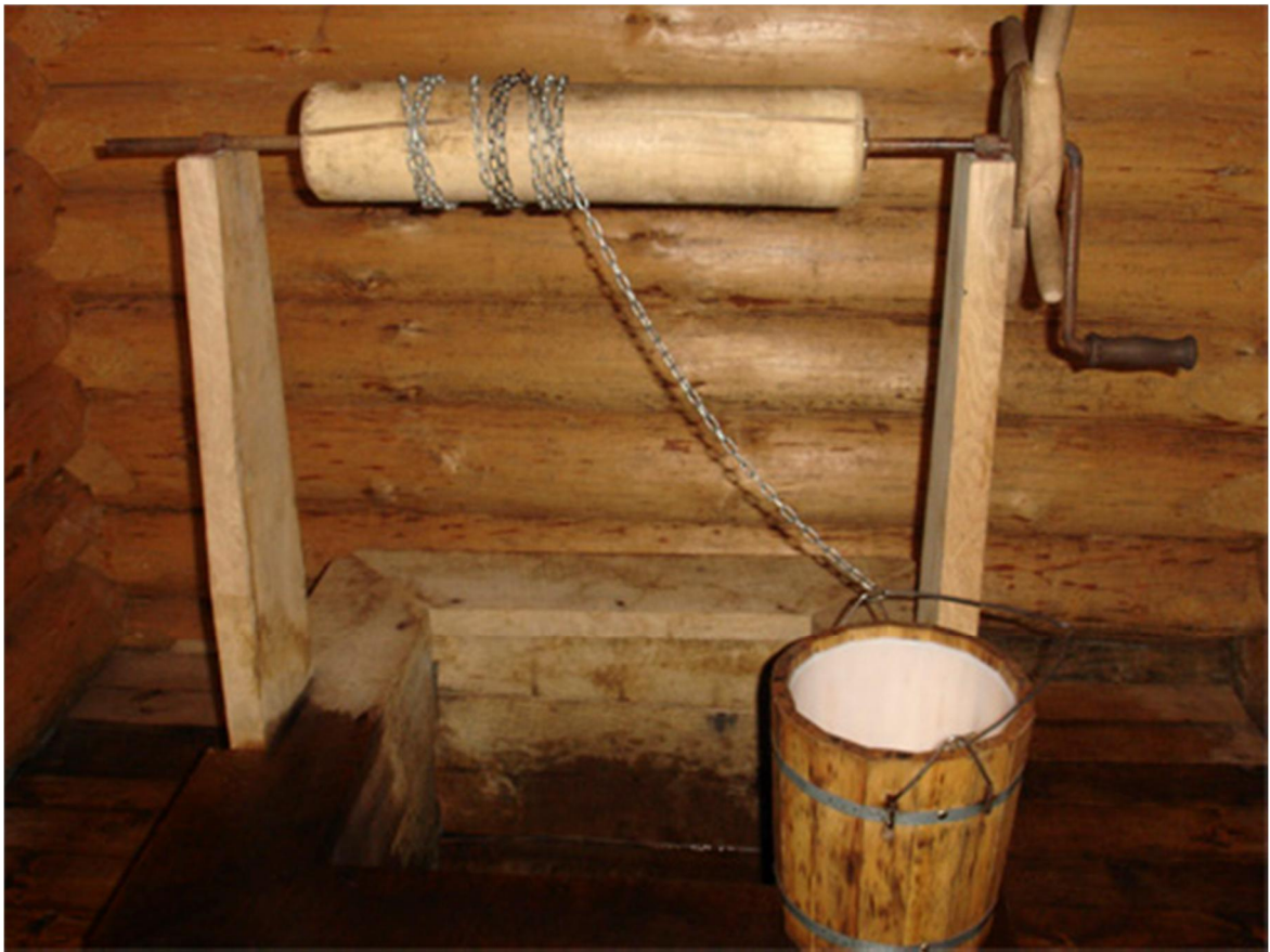
В колодце – святая вода из трех источников