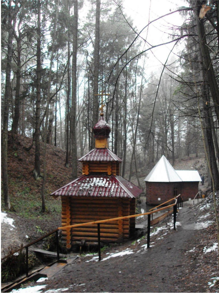
Сруб над колодцем, в который стекается вода из трех источников