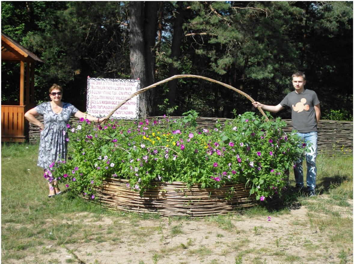
Территория, прилегающая к источнику, украшена клумбами