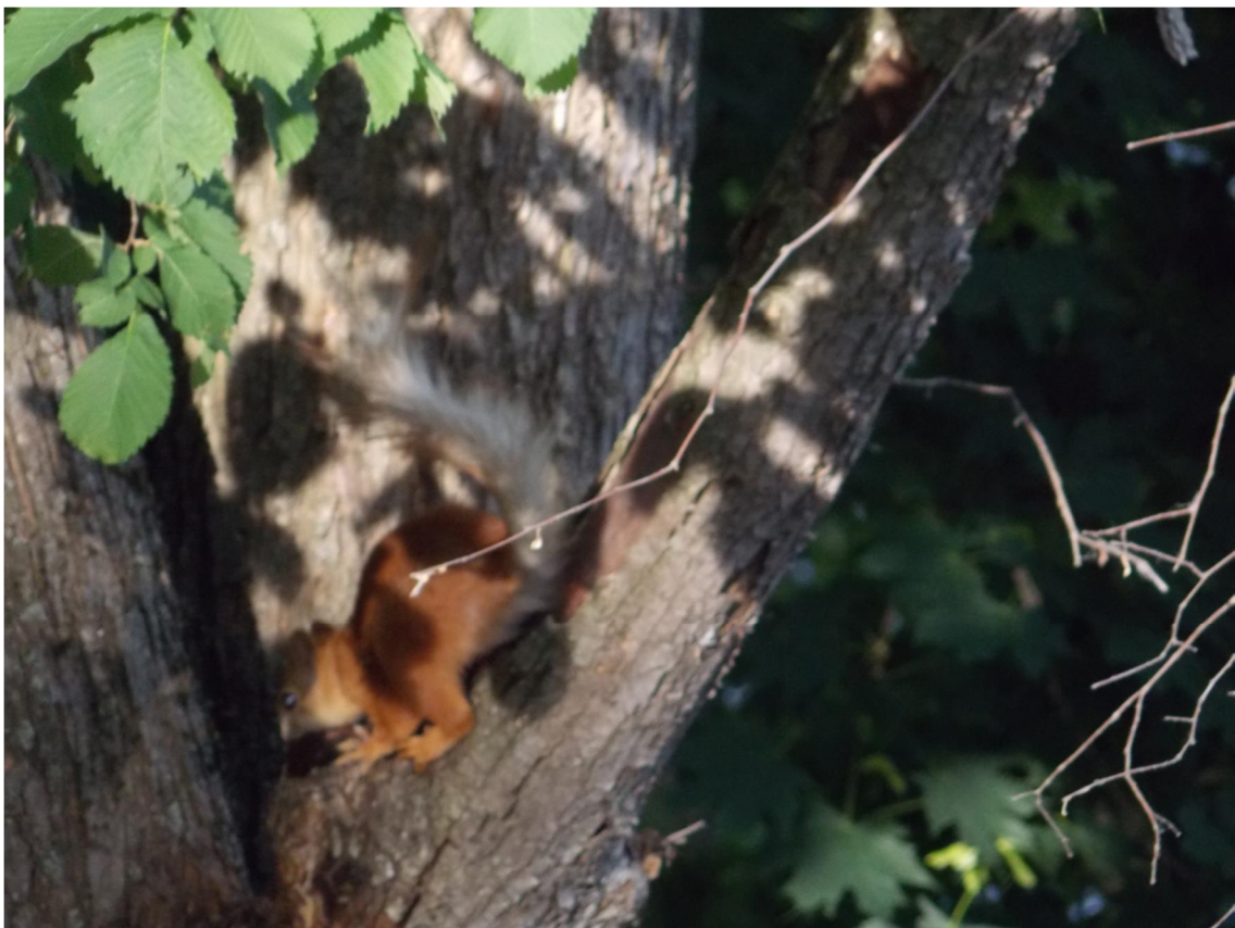
Над родниковой водой по веткам смешанного леса скачут озорные белки