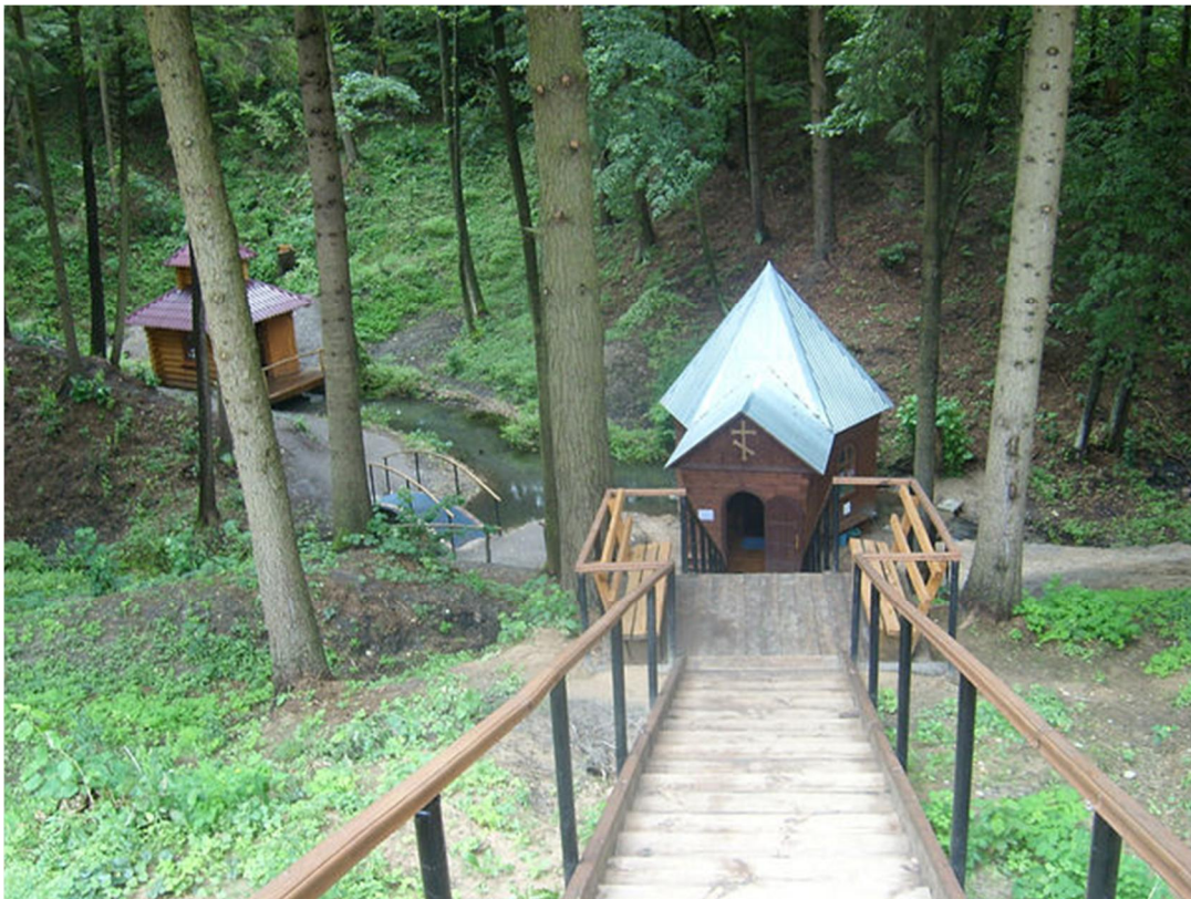
Деревянная лестница приводит к купели